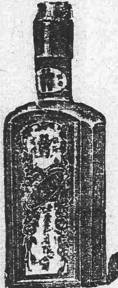
大號七角 貳號四角貳 三號貳角八 四號壹角四